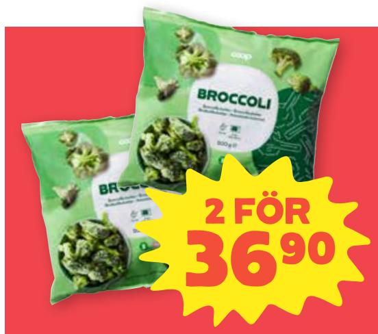
Broccoli Coop. Fryst. 500 g. Jfr-pris 36:90/kg.