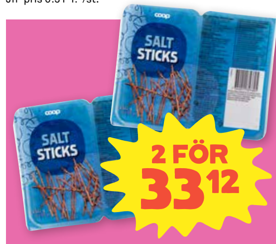
Salta pinnar Coop. 250 g. Jfr-pris 66:24/kg.

Blandfärsen innehåller 50% naturbeteskött.