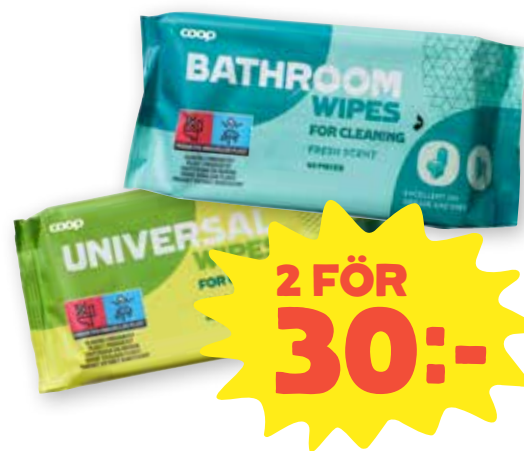
Städservetter Coop. Välj mellan olika sorter. 15-48 st. Jfr-pris 0:31-1:-/st.