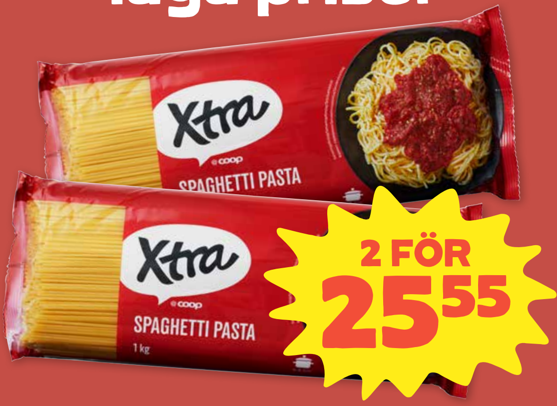
Spaghetti Xtra. 1 kg. Jfr-pris 12:78/kg.