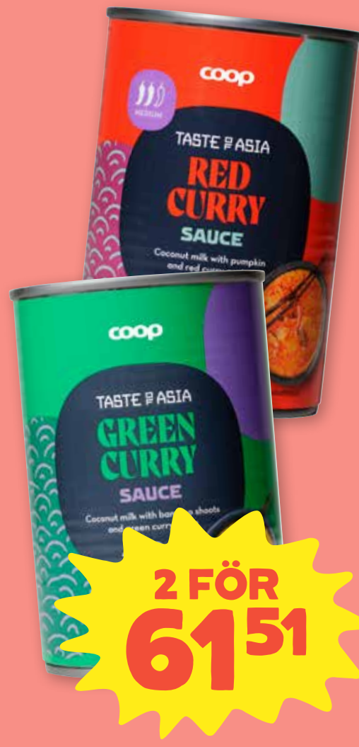
Curry grytbas Coop. Välj mellan panang curry, red curry och green curry. 400 ml. Jfr-pris 76:89/liter.