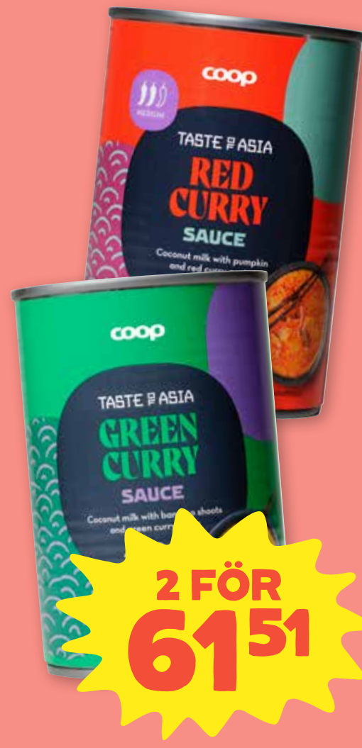
Curry grytbas Coop. Välj mellan panang curry, red curry och green curry. 400 ml. Jfr-pris 76:89/liter.