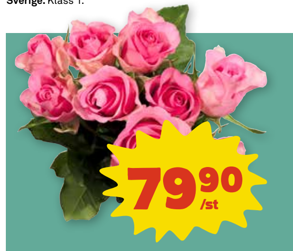
Rosor 9-pack Fairtrademärkta. Välj mellan olika färger.