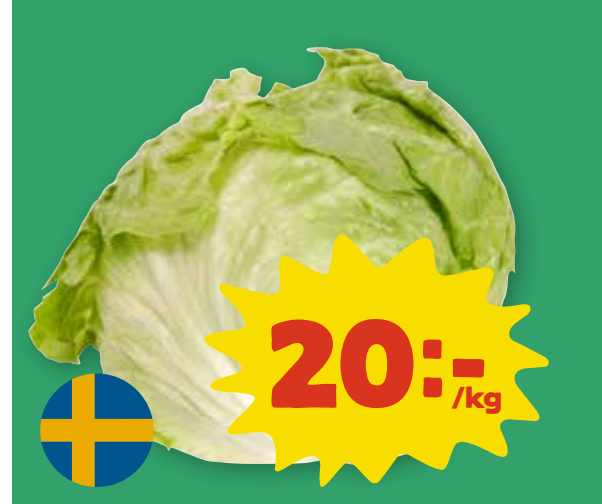
Isbergssallad Sverige. Klass 1.