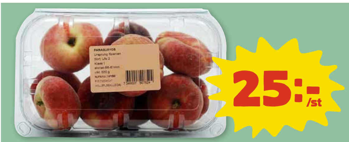
Paraguayos i ask Spanien. Klass 1. 500 g. Jfr-pris 50:-/kg.

Vår färskvarugaranti: Dubbla pengarna tillbaka om du inte är helt nöjd. Ta med varan och kvittot till din butik.