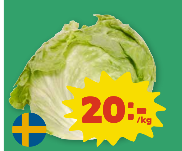
Isbergssallad Sverige. Klass 1.