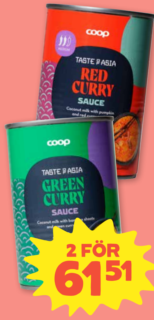
Curry grytbas Coop. Välj mellan panang curry, red curry och green curry. 400 ml. Jfr-pris 76:89/liter.